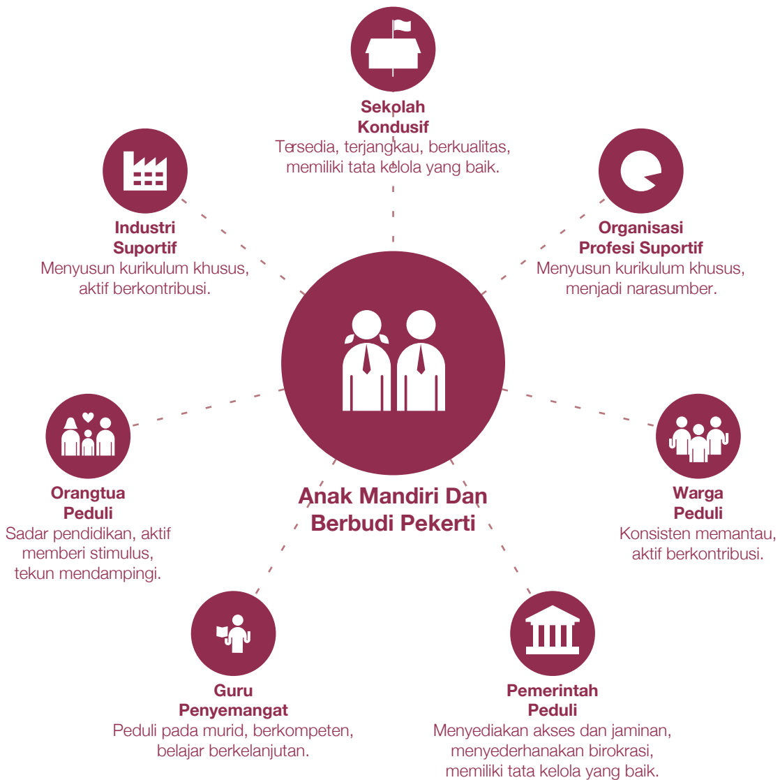
Infografis 2.1 Model Operasional Kemitraan Sekolah, Keluarga, dan Masyarakat

Model kemitraan antara sekolah, keluarga, dan masyarakat secara konseptual dapat digambarkan seperti tampak pada infografis 2.1. Sedangkan secara operasional model ini dapat dikembangkan atas dasar pendayagunaan potensi dan sumber daya keluarga dan masyarakat secara kolaboratif. Kemitraan dibangun di atas dasar kebutuhan anak sehingga orang tua/wali dan masyarakat diharapkan dapat berpartisipasi aktif dalam kegiatan yang berkaitan dengan sekolah. Model kemitraan melibatkan jejaring yang luas dan melibatkan peserta didik, orang tua, guru, tenaga kependidikan, masyarakat, kalangan pengusaha, dan organisasi mitra di bidang pendidikan.